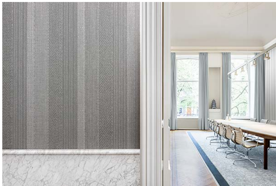
Wandbekleidung – Dessin Switch

Linien und Switch präsentieren sich mit einem markanten Schuss- und Kettfaden, ein Merkmal, das auf ihren textilen Ursprung hinweist. Bei Linien wird das organische Muster durch die Bewegung der Fäden erreicht. Durch das Zusammenspiel von traditioneller Weberei und neuer Technologie entsteht ein klassischer Look aus modernem Material. Auf ähnliche Weise spielt Switch mit dem zeitlosen Fischgrätmuster. Wechselnde Streifen des Fischgrätmusters und Leinenbindung bilden ein komplexes Design, dessen Muster sowohl interessante Nahansichten bietet als auch eine breite Textur aus der Ferne. Wie auch die anderen Dessins dieser Kollektion sind beide Produkte in neutralen Tönen gehalten.