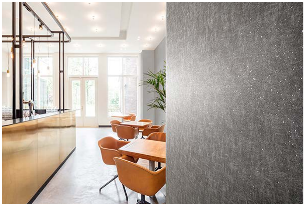
Wandbekleidung – Dessin Montado