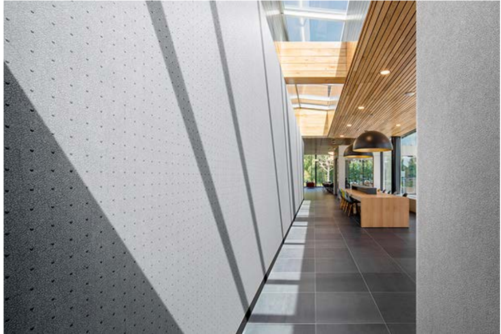
Wandbekleidung – Dessin Kai & Fenda

Vescom kombiniert die verschiedensten Techniken wie Bedrucken, Färben, Beschichten, Crushing, Prägen, Flocken, Lasern und Laminieren. Daraus entstehen viele bemerkenswerte Dessins. Die Prägung von Zagara erinnert beispielsweise an lackiertes japanisches Holz. Das Dessin Fenda entsteht ebenfalls durch ein aufwändiges Prägeverfahren, wirkt aber schlicht und ästhetisch. Kai besteht wiederum aus einem Raster dreidimensionaler Punkte. Das Dessin erinnert an handgefertigtes Leder und ist in zehn Farbtönen erhältlich.