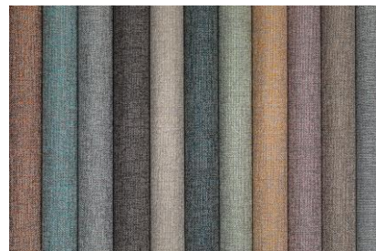
Dekorationsstoffe – Dessin Ellis

Ein weiterer Vorteil: Vorhänge können den Lichteinfall in einem Raum regulieren und das Raumklima verbessern. Da jeder Raum diesbezüglich andere Anforderungen stellt, gibt Vescom für alle fünf Vorhangstoffe den Wert für die gesamte Sonnendurchlässigkeit (gtot) und den Lichtdurchlässigkeitswert an.