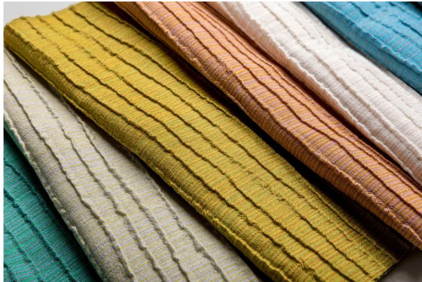
Dekorationsstoffe – Dessin Naltar