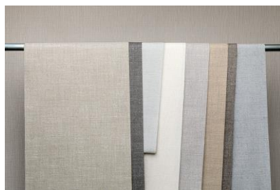
Dekorationsstoffe – Dessin Rona

Neben der Hygiene rücken zunehmend praktische Lösungen für das „Social Distancing“ in den Vordergrund. Das gestiegene Sicherheitsbedürfnis hat zu einer Welle von provisorischen Lösungen für Raumabtrennungen geführt. Vorhangstoffe von Vescom stellen hierfür eine stilvolle Alternative dar. Denn viele Dessins wie auch Rona und Ellis werden deckenhoch hergestellt und können in einer Bahn zu einer nahtlosen und kostengünstigen Raumaufteilung installiert werden.