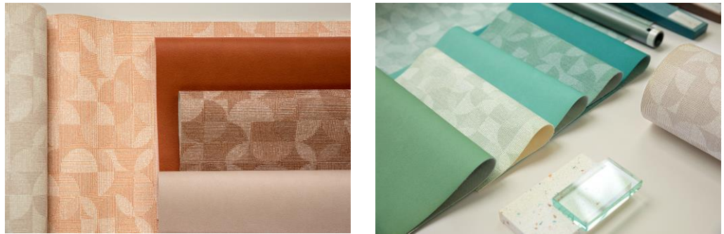
Vinyl-Möbelstoff - Design Arches

Vinyl-Möbelbezüge werden oft als kalt und steril angesehen – ein Vorurteil, das Arches mit seinem wohnlichen Aussehen klar widerlegt. Von der Jacquard-Weberei inspiriert, vermittelt ein grafischer Druck in changierenden Farbnuancen den Eindruck verschiedener Gewebearten in einem Muster. Aufgrund des textilen Looks und des ungerichteten Musters eignet sich Arches perfekt als Bezugsstoff für verschiedenste Arten von Sitz- und Liegemöbeln. Bei der Umsetzung des Farbkonzepts gelang es Vescom, Eleganz und Detailreichtum mit Behaglichkeit und Wärme in Einklang zu bringen.