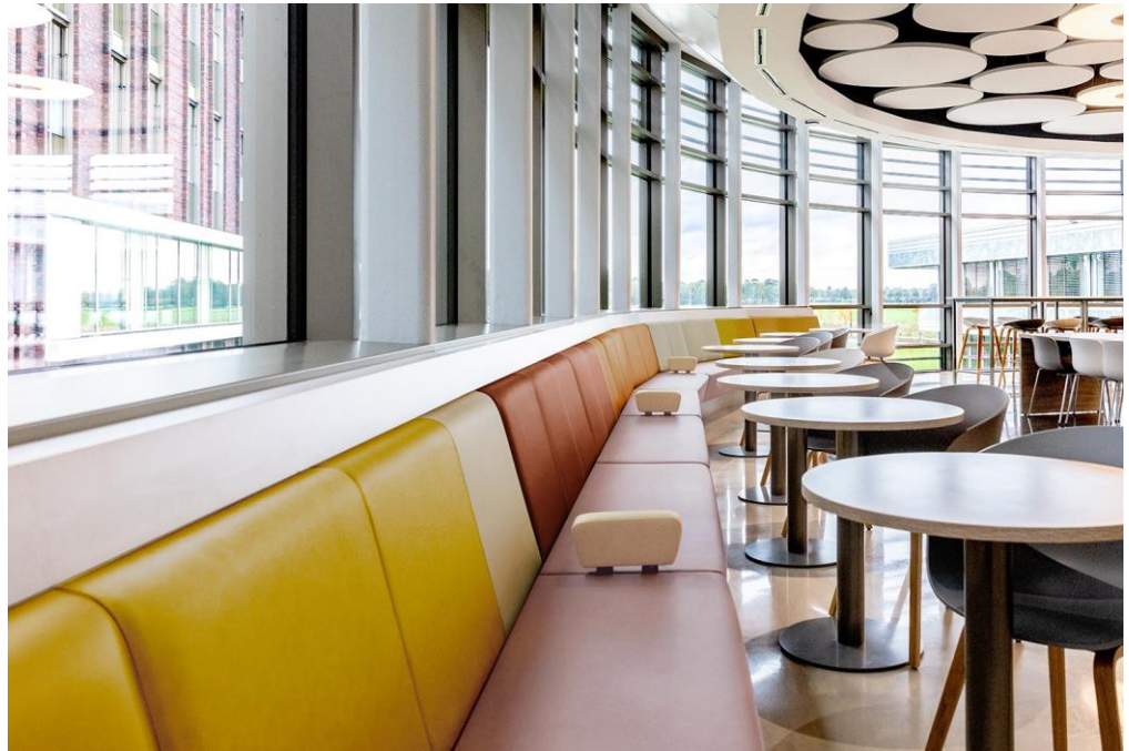
Vinyl-Möbelstoff - Design Furka Plus

Die farbliche Neuauflage von Furka Plus verzichtet auf knallige Farbtöne, die oft mit Vinylbezügen in Verbindung gebracht werden. Die große Farbauswahl umfasst jetzt ausdrucksstarke und moderne Töne, darunter satte Terrakotta-, Honig- und Kurkuma-Töne, Meeres- und Moosgrün, dunkle Aubergine, Palisander sowie Himmel- und Schieferblau. Zu den dezenteren Optionen gehören ruhige Neutraltöne, weiche Pastellfarben und natürliche Ledertöne.