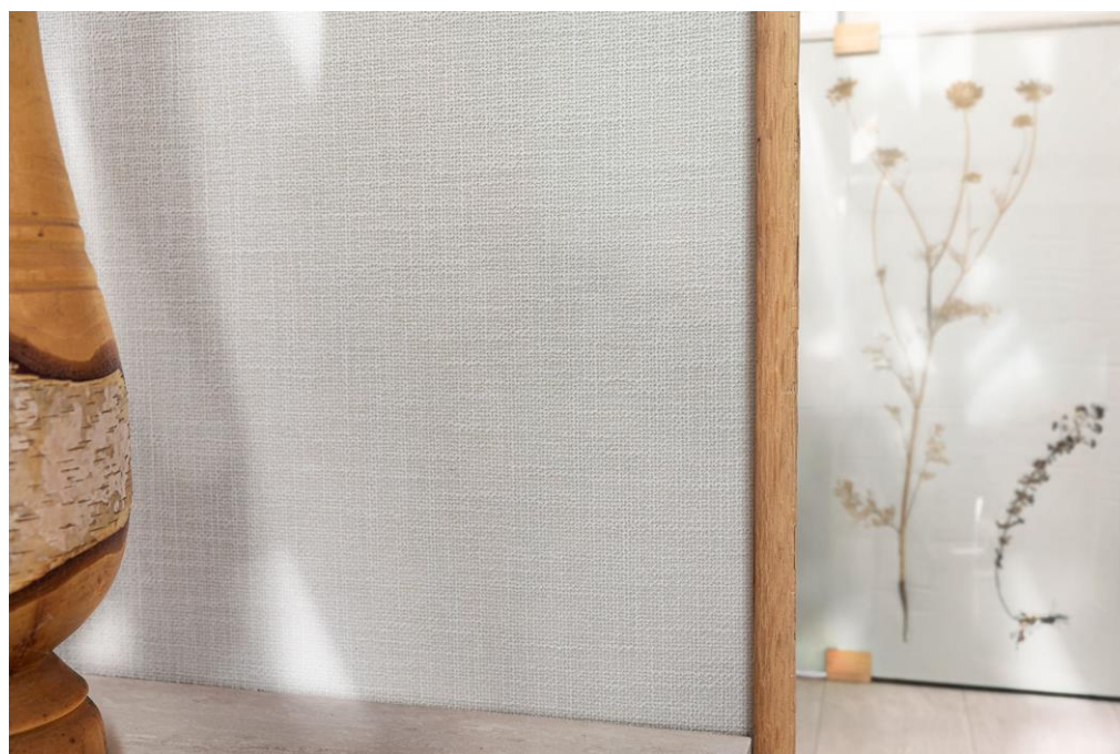
Wandbekleidung – Dessin Ethnic Linon

Die gesamte Leinen-Wandbekleidungskollektion von Vescom umfasst nun 26 Dessins und ist eine Hommage an die natürliche Schönheit und Vielfalt von Leinen. Alle Dessins sind sorgfältig verarbeitet, nicht überdesignt und bieten eine große Auswahl an Strukturen, Mustern, Garnen und Effekten. Sie kombinieren Handarbeitsoptik mit anspruchsvollen, modernen Techniken. Durch Prägungen, Beflockung und Laserdruck entstehen besondere Haptiken und Dreidimensionalität. Techniken wie Zerstoßen, Zerreiben und Bürsten führen zu einer Patina im Vintage-Look. Auf der anderen Seite veredeln Verfahren wie Laminieren, Beschichten und Metallics die Stoffe mit einer dekorativen Schicht, die ein dynamisches Spiel zwischen matt und glänzend erzeugt.