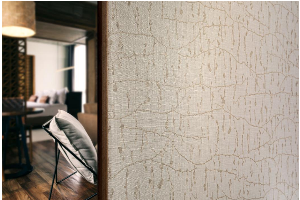
Wandbekleidung – Dessin Ivylin

Die Farbauswahl berücksichtigt den natürlichen Ursprung von Leinen: Sie besteht aus klassischen Neutraltönen, pflanzlich inspirierten Farbtönen wie Gewürzfarben und aus Erdtönen.