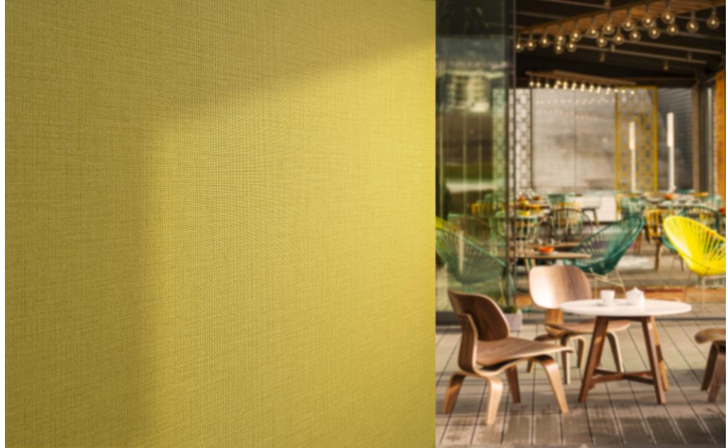
Wandbekleidung – Dessin Sila

Die Farbpalette von Sila umfasst 25 strahlende, frische Frühlingsfarben, darunter sanfte, luftige Pastelltöne, aber auch leuchtende Ringelblumen- und Lavendel-Farben. Moosige und grasige Grüntöne sowie blaue Schattierungen, die an das Aquamarin eines unberührten Sees oder an ferne Berglandschaften erinnern, vervollständigen die Farbauswahl.