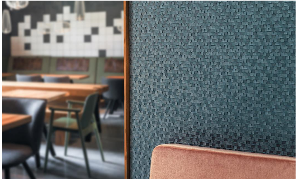
Wandbekleidung – Dessin Shannon

Papier oder strukturierte Keramik erinnern. Einige Farbschattierungen lassen die Tapete wie Mosaikfliesen oder Stein wirken, während andere von kostbaren Juwelen und Edelsteinen inspiriert wurden. So finden sich Smaragdgrün, Lapislazuli-Blau, goldener Bernstein und Rosenquarz in der Farbauswahl. Mit Erdtönen wie Anthrazitschwarz, Granitgrau, Tonbraun und brüniertem Kupfer stehen außerdem eine Reihe von Naturtönen zur Verfügung.