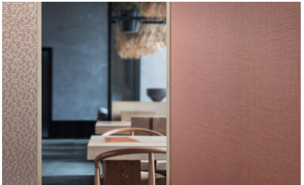
Wandbekleidung – Dessin Sila

Hinter Silas schlichtem und doch raffinierten Design verbirgt sich Innovation auf höchstem Niveau. Sila sieht aus wie ein gewebter Stoff und wirkt damit auf den ersten Blick eher unspektakulär. Doch die Struktur dieses Dessins basiert auf einem umfangreichen Know-how und modernsten technologischen Prozessen. Die ultrafeine Zusammensetzung und die filigrane Prägung des Wandbelags unterstreichen Vescoms Kompetenz in der 3D-Designentwicklung.