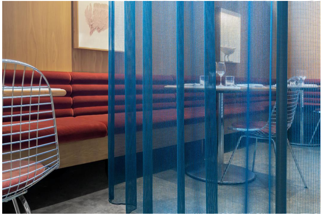
Dekorationsstoff – Dessin Teon