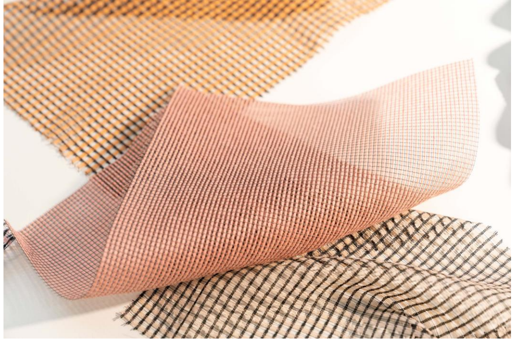
Dekorationsstoffe – Dessins Teon und Nias

Nias ist Teil von Vescoms wachsender Palette an Recycling-Produkten. Die für das Dessin verwendeten farbigen Garne finden sich auch in Vescoms neuer Möbelstoff-Familie aus 100 Prozent Post-Consumer Recyclingmaterial, so dass sich diese nachhaltigen Produkte ausgezeichnet kombinieren lassen.